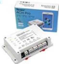
Ovládanie 4 zariadení DIN lišta 3-módy