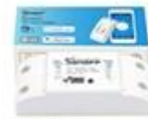
Smart BASIC alebo RF diaľkové ovládanie