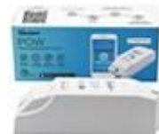
Meranie spotreby el. energie 16A