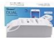
Ovládanie 2 zariadení 16A