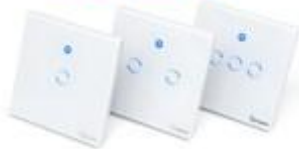
dotykový vypínač 1-2-3 gang